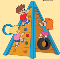
IĆI U PARK