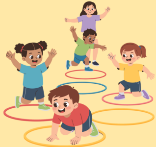
IGRA S KOLUTOVIMA