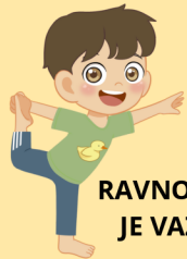
RAVNOTEŽA JE VAŽNA