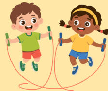
SKAKANJE PREKO UŽETA