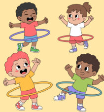
ZAVRTITI KOLUT OKO STRUKA