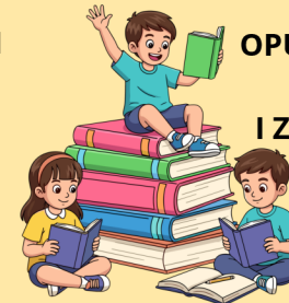
OPUŠTANJE, OTKRIVANJE NOVOG I ZANIMLJIVOG SVIJETA