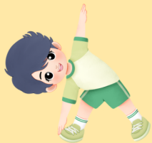
JOŠ MALO ISTEZANJA