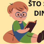
ŠTO SU RADILI DINOSAURI

ŠTO MOGU NOVO OTKRITI U AVANTURI ČITANJA?