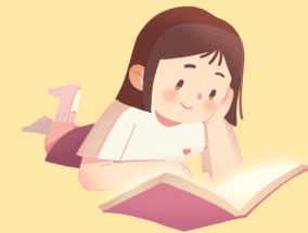
KAKO SE OPUSTITI U DNEVNIM OBAVEZAMA